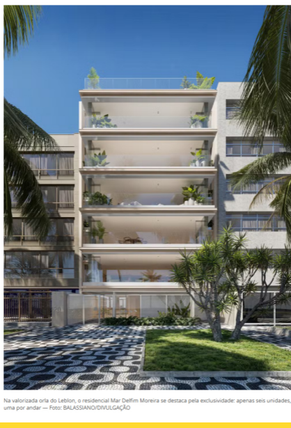
Na valorizada orla do Leblon, o residencial Mar Delfim Moreira se destaca pela exclusividade: apenas seis unidades, uma por andar