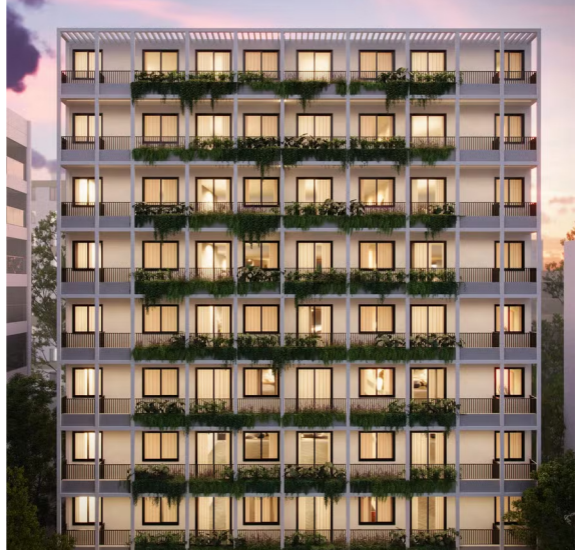
Fachada da torre em estilo art déco do Paradís

Dono do metro quadrado mais caro da cidade — e um dos mais altos do país —, o bairro mais badalado da Zona Sul tornou-se um ícone no mercado imobiliário carioca e uma importante referência de alta qualidade de vida. O Leblon tem demanda permanente de pessoas interessadas em morar em suas ruas arborizadas e repletas de lojas, bares e restaurantes, que atraem também investidores de outros estados brasileiros ou estrangeiros seduzidos pela rentabilidade dos aluguéis de curta temporada.